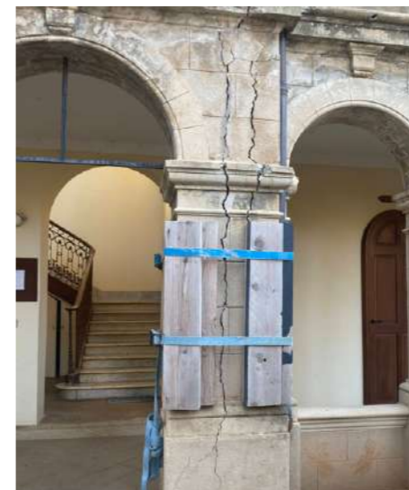
Colonne du cloître