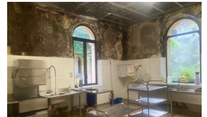
Pièce réservée à la vaisselle